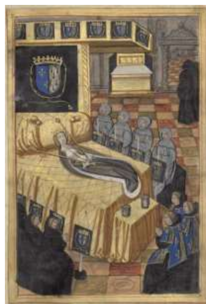
7. Sterfbed Anna van Bretagne,