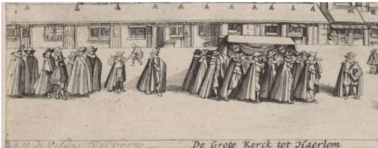
8. rouwstoet met vooraan de drager met wapenbord, 1628

Oude tekeningen geven aan dat een rouwbord werd aangebracht op sterfhuizen en meegedragen in de rouwstoet naar de begraafplaats in de kerk. Na de plechtigheid kreeg het daar een plaats dicht bij het graf. In 1628 was het bord nog eenvoudig, zoals te zien is op een ets van Jan van de Velde, waar hij een deftige begrafenisstoet tekende voor de St. Bavokerk in Haarlem. 11 Het is de vraag of de grote rouwborden met houten omlijstingen (rouwkassen) uit later tijd, zoals die nu nog in kerken en musea hangen, ook zijn meegedragen. Waarschijnlijk was toen na een overlijden eerst volstaan met een eenvoudig draagbaar paneel, en werd naderhand voor bij het graf een tweede gemaakt in een veel rijkere uitvoering, om meer pracht en praal te kunnen uitstralen naar toeschouwers in de kerk.