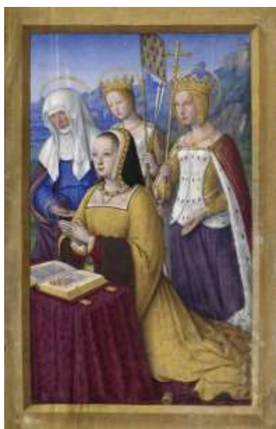
5. Anna van Bretagne 1514