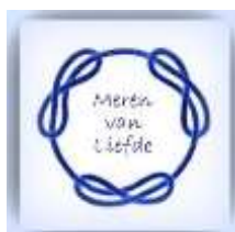
6. embleem l'Ordre de la Cordelière