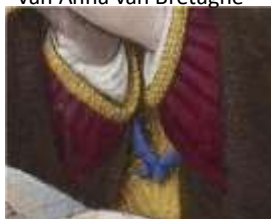
5a. blauwe cordelière van Anna van Bretagne