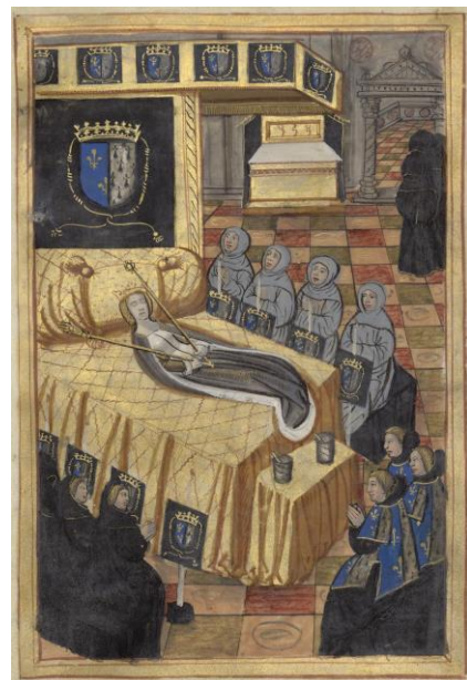
7. Sterfbed Anna van Bretagne, 1514