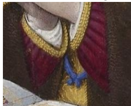
5a. blauwe cordelière van Anna van Bretagne