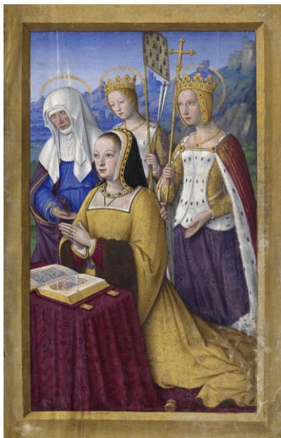
5. Anna van Bretagne