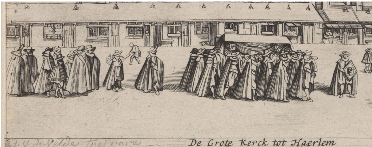
8. rouwstoet met vooraan de drager met wapenbord, 1628

Oude tekeningen geven aan dat een rouwbord werd aangebracht op sterfhuizen en megedragen in de rouwstoet naar de begraafplaats in de kerk. Na de plechtigheid kreeg het daar een plaats dicht bij het graf. In 1628 was het bord nog eenvoudig, zoals te zien is op een ets van Jan van de Velde, waar hij een deftige begrafenisstoet tekende voor de St. Bavokerk in Haarlem. 11 Het is de vraag of de grote rouwborden met houten omlijstingen (rouwkassen) uit later tijd, zoals die nu nog in kerken en musea hangen, ook zijn megedragen. Waarschijnlijk was toen na een overlijden eerst volstaan met een eenvoudig draagbaar paneel, en werd naderhand voor bij het graf een tweede gemaakt in een veel rijkere uitvoering, om meer pracht en praal te kunnen uitstralen naar toeschouwers in de kerk.