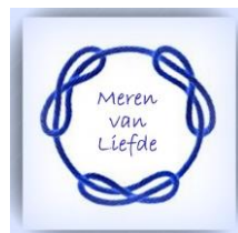
6. embleem van haar Orde